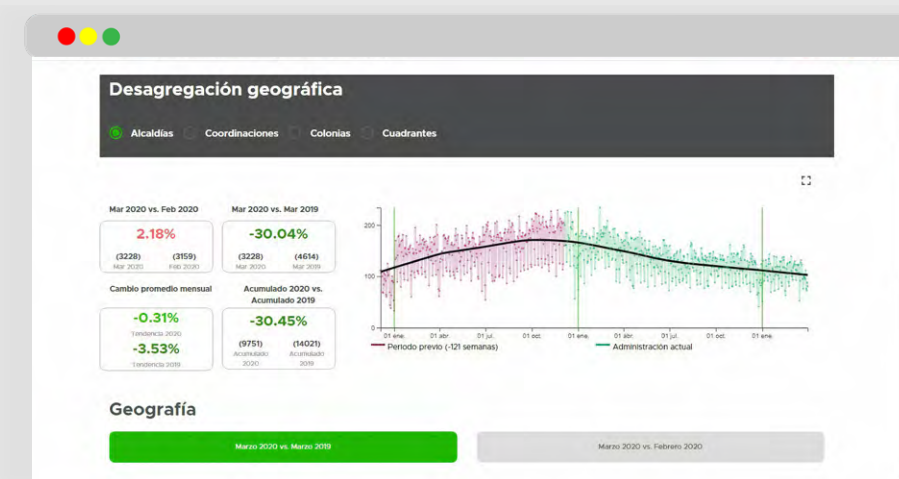
*Imagen correspondiente al punto 9