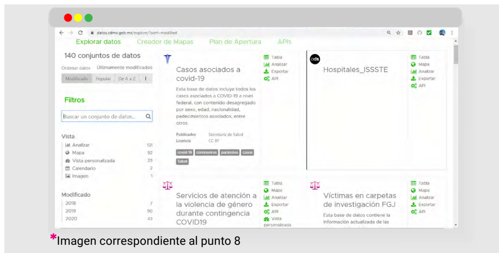
*Imagen correspondiente al punto 8

9. La plataforma contiene un apartado para iniciar contacto con los operadores de la Agencia Digital de Innovación Pública. En la sección de "Centro de Apertura" https://centrodeapertura.datos.cdmx.gob.mx/ cualquier persona puede: a) proponer nuevas bases de datos; b) sugerir cambios a alguna base de datos existente o c) proponer mejoras a la estrategia de Datos Abiertos de la CDMX.*