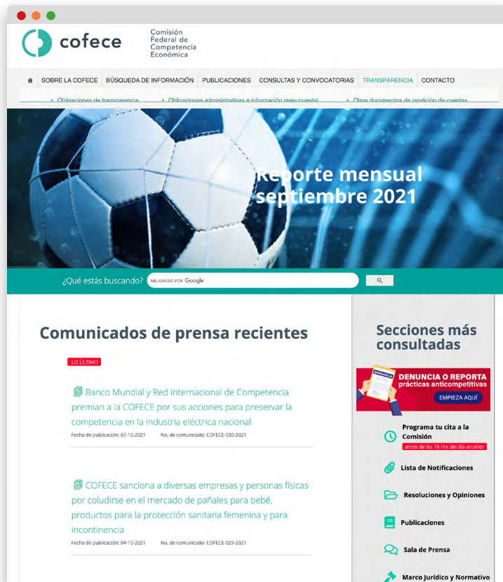
Visualización del inicio

• Recientemente se abrió el nuevo apartado "Videos" para darle espacio a los diferentes videos que la Comisión ha publicado en su canal de YouTube , para colocar más información disponible para el público en general con gran contenido visual y explicativo de los temas de competencia.