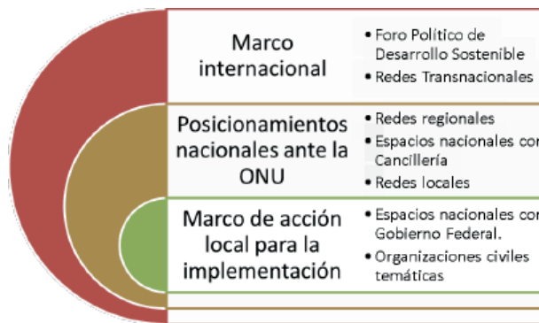
Figura 1. Marco de acción de la gobernanza en política exterior.

Nota: Elaboración propia para este artículo. ç