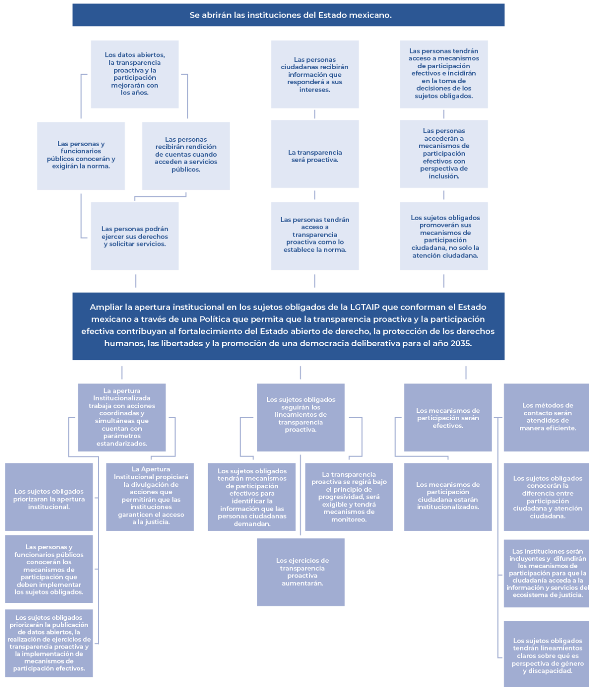
Figura 2. Árbol de objetivos de la Política de Apertura Institucional