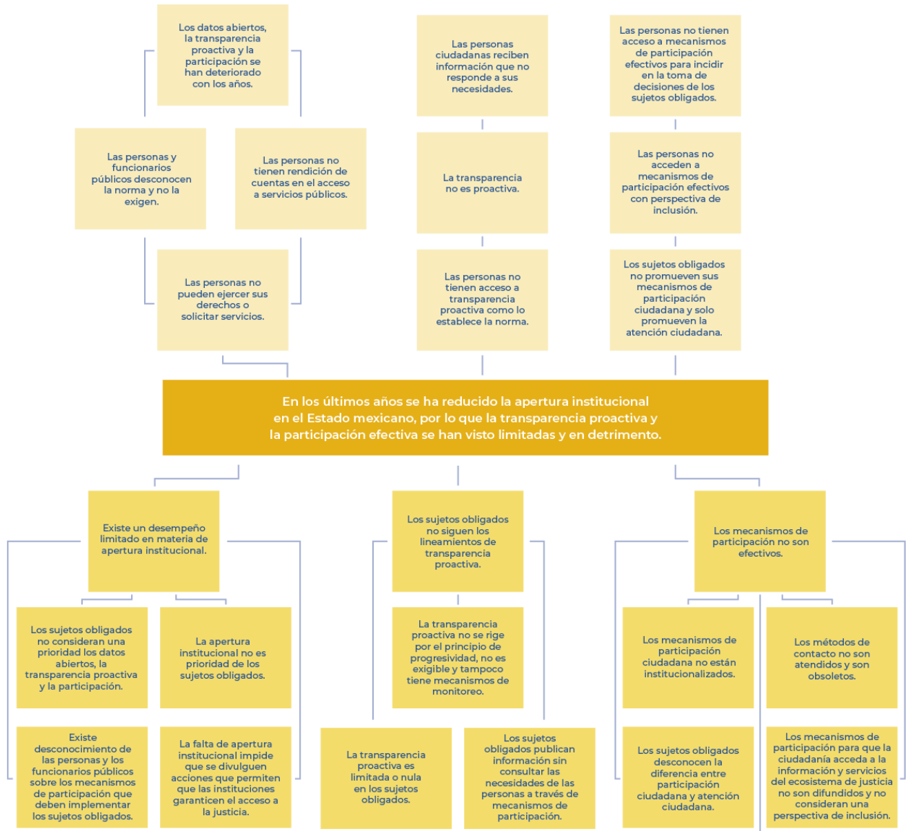
Figura 1. Árbol de problemas de la Política de Apertura Institucional