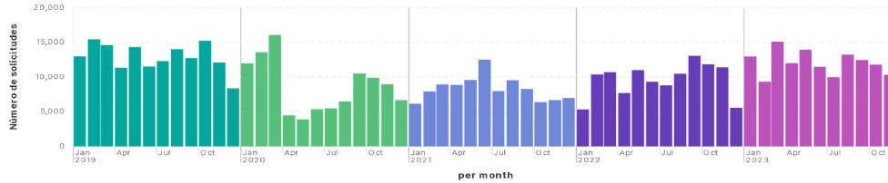
Solicitudes de información atendidas por mes