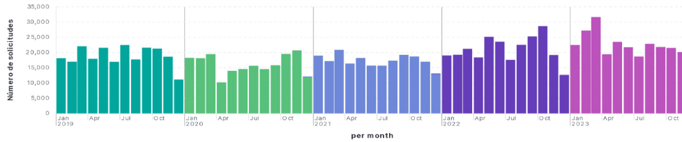
Solicitudes de información atendidas por mes